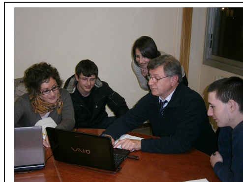
foto 2VIII Workshop - Sala Assessori - Fara in Sabina

Ad ogni partecipante è stato anche consegnato il testo “La Metodologia della Formazione-Intervento®”. I partecipanti sono stati formati sul tema del Marketing territoriale ed hanno sviluppato la progettazione di contenuti di alimentazione del portale in dotazione ai comuni dell'Associazione SER.A.R.. Ciascuno ha formalizzato il proprio percorso progettuale su un power point di progetto. I progetti assegnati sono stati: